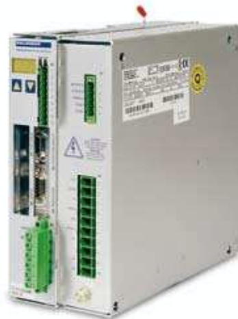
SERVOSTAR® 400 M

Durant la mise en service, les paramètres de réglage peuvent être optimisés online – avec le variateur en fonction. La technique de fenêtre permet la représentation simultanée de plusieurs servoamplificateurs interconnectés via le bus CANopen qui est de base. Fonction oscilloscope intégrée, Bode plot, le code ASCII est lisible à travers notre programme, données moteurs et paramétrages moteurs intégrés dans nos systèmes permettant une mise en route facile et accessible à tous.