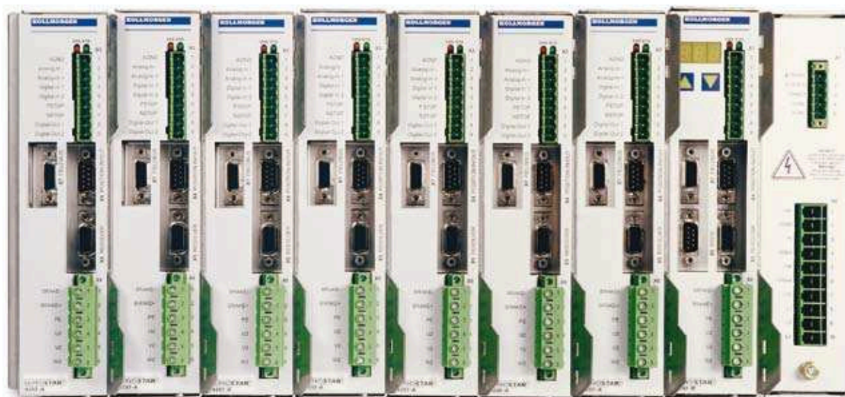
SERVOSTAR® 400 8 Axis